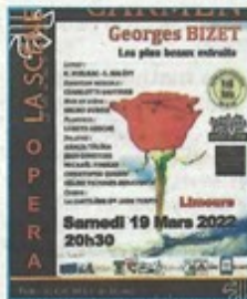
L'affiche du concours de nouvelles et de l'Opéra Carmen.

La programmation débutera le vendredi 11 mars par un voyage poétique, "Les fées papillon", proposé par l'association EssenCiel à La Grange de Limours (20h30). Organisé depuis 1995, le festival Méli-Mélo sera, comme le veut la tradition, officiellement lancé lors du vernissage de l'exposition de peintures des jeunes adultes polyhandicapés de l'Association "Les Tout-Petits"